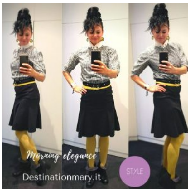
collant gialli-un raggio di sole